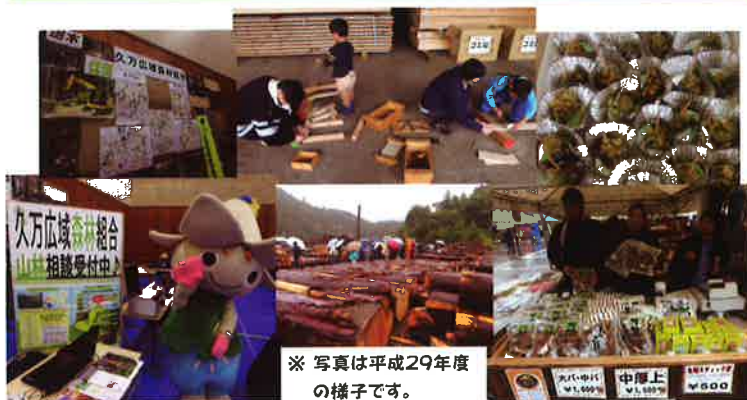
※写真は平成29年度の様子です。