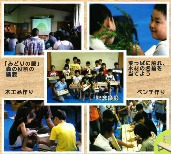
「みどりの服」森の役割の講義

今後も、このようなイベントに積極的に取り組み、木材の良さや森林の大切さを広く伝えて参ります。