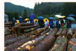
林業まつり同時開催記念市

今後の見通しとしては、今の出材状況では原木不足で各製材業者とも原木調達に苦戦している為、大幅な価格の低下はないものと考えております。