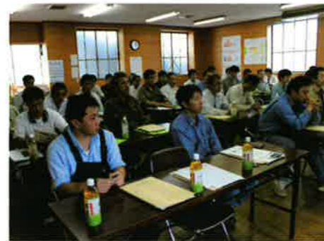
熱心に講義に耳を傾けている様子