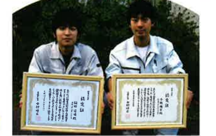
今年は2名の職員が森林施業プランナーの資格を優秀な成績で取得いたしました。