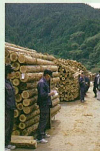
▲ 積み上げられた材