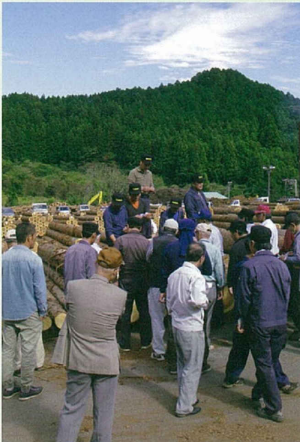
▲ 札を次々に持ち寄る買い手さん