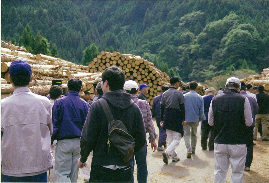
▲ 木材の品定めをしながら会場を歩く買い手の皆様

木口をじっと見つめる人、見事な原木の前で一気に活気づく風景等、記念市は普段の市売りとは違った顔をのぞかせます。