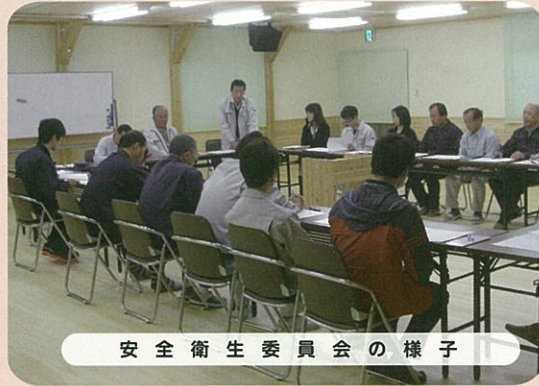
安全衛生委員会の様子

当組合では、毎月一回安全衛生委員会を開催しています。 総務部、森林部、久万事業所、父野川事業所の各事業所から安全衛生委員が選出され、職場の安全を向上させる話し合いをしています。