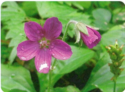
10月下旬 中津にて撮影