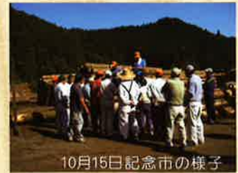
10月15日記念市の様子

最後に今年も昨年同様出材のほどよろしく宜しくお願い申し上げます。 木材市場 中嶋