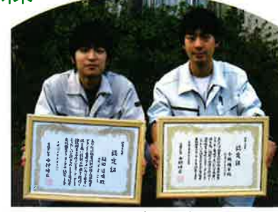
今年は2名の職員が森林施業プランナーの資格を優秀な成績で取得いたしました。