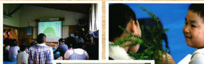
「みどりの服」森の役割の講義

今後も、このようなイベントに積極的に取り組み、木材の良さや森林の大切さを広く伝えて参ります。