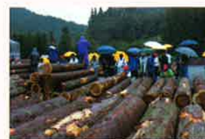
林業まつり同時開催記念市

今後の見通しとしては、今の出材状況では原木不足で各製材業者とも原木調達に苦戦している為、大幅な価格の低下はないものと考えております。