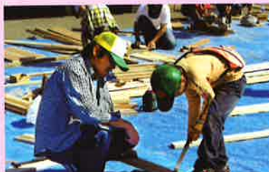
おまつり広場での親子木工