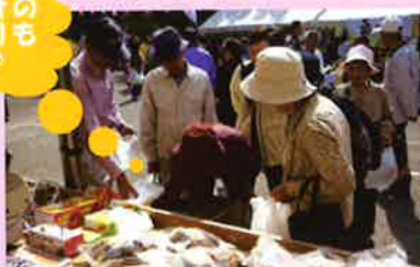
お茶や林業資材などの購買商品