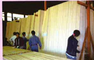
久万事業所にて木材の展示即売