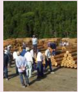
にぎわいある記念市

林業家の皆様には日頃より大変お世話になり誠にありがとうございます。 今年度の木材価格は、昨年に比べ平均で約1,300円以上高く良好な取引が続いており、昨年の厳しい状況に比べると若干いいようです。 今後の状況ですが、他の地区の出材状況が非常に悪いいため全体に原木不足となっており、今のところ大きな価格変動はないものと考えております。 久万地区に関しましてはお陰様で出材が非常に多く、当市場と致しましても入荷に対し整木作業が追いつかない状況で、出荷者の皆様には大変ご迷惑をおかけし心より申し訳なく思っております。 今後も全力で対応して参りますので、今年もよろしくお願い申し上げます。