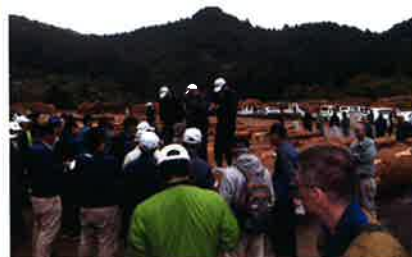
▲賑わう市売りの様子