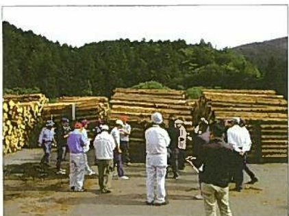
▲平成28年10月15日記念市の様子 初の試みの町内3市場共同の市売りで、 全国から多くの買い手が訪れ賑わいました。