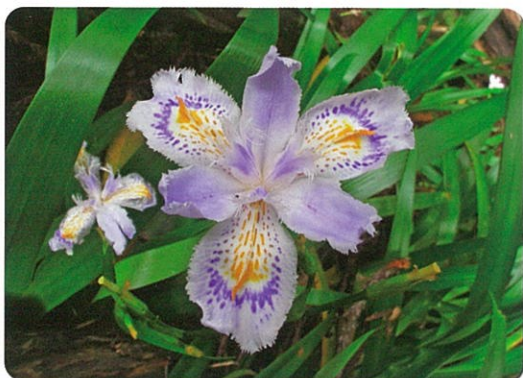
6月上旬 柳井川にて撮影